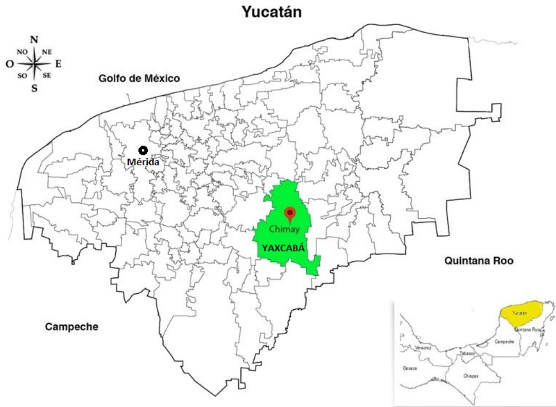
Figura 1: Estado de Yucatán. Municipio de Yaxcabá (en verde). Comunidad de Chimay (punto rojo).

en el resto la vegetación natural o en distintas etapas de sucesión. Concentra el 28% de las colmenas de la entidad. (García de Fuentes & Córdoba y Ordóñez 2010: 69).